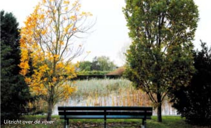
Uitzicht over de vijver